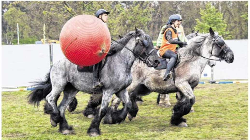
Rund 20 Kaltblüter, die diverse Fähigkeiten vorführen, sind die Attraktion beim Mützenicher Turnier.

Die Reitvereine des ehemaligen Kreises Monschau kämpfen am Freitag in der Dressur und am Sonntagmorgen im Springen um den Stadtmeister-Titel. Am Sonntag bildet eine Zwei-Sterne-M-Dressur den Auftakt in der Reithalle, der sich eine S-Dressur an-