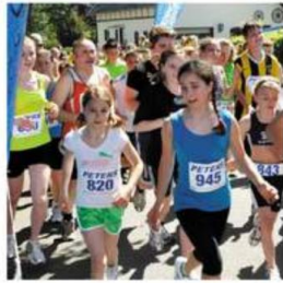
Seit 2011 motiviert der „run4school“ jährlich viele Jugendliche zum Mitmachen beim Mützenicher Vennlauf.

Die Teams der Elwin-Christoffel-Realschule, des Franziskus-Gymnasiums Vossenack, der Förderschule Nordeifel, der GHS Monschau-Roetgen-Simmerath und des Monschauer St.-Michael-Gymnasiums haben bereits die Fünf-